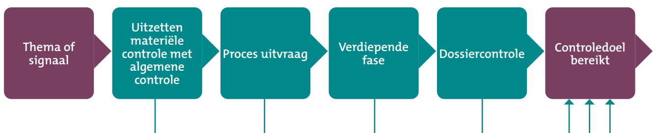
Afbeelding 2 Controlemiddelen

Als een dossiercontrole uitgevoerd wordt, wordt er op basis van declaratiegegevens voor de geselecteerde zorgaanbieder een cliëntselectie bepaald. Uiterlijk twee weken voorafgaand aan de controle wordt de cliëntselectie verstuurd. De cliëntdossiers van deze cliënten dienen op de dag van controle inzichtelijk te zijn voor de controleurs. CZ zorgkantoor werkt volgens het Protocol materiële controle (ZN). Hierdoor is voor inzage in de cliëntdossiers geen toestemming van de cliënt noodzakelijk.